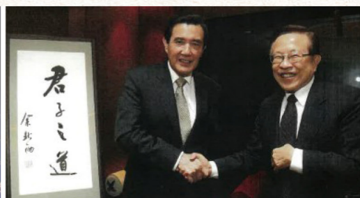
2016年馬英九總統卸任前高希均致贈余秋雨的「君子之道」書法。