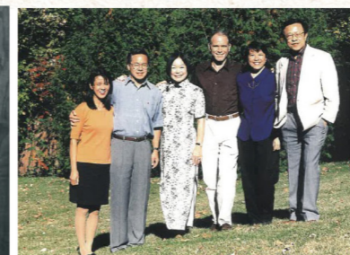
1997年家人合照於威州河城家中前院。