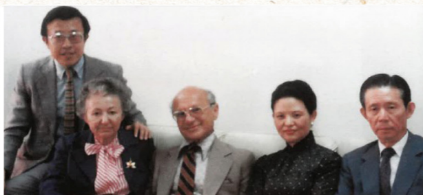
1981年8月，左起王永慶夫婦與諾貝爾獎得主傅利曼夫婦在台北生活素質研究中心合影。