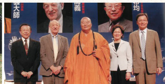
2013年佛光山上舉辦「星雲人文世界論壇」，右起蘇起博士、王力行發行人、星雲大師、傅高義教授、高希均教授。